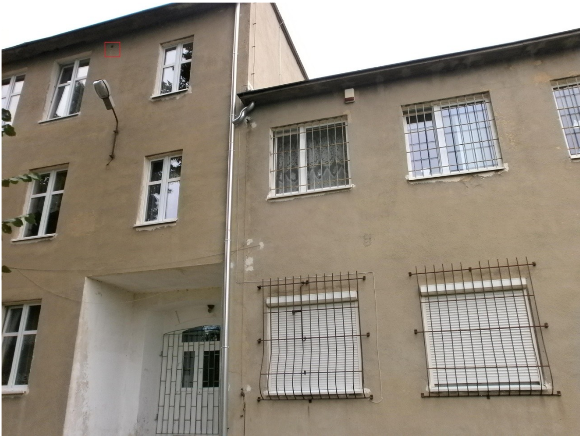
Fot. 1. Oznaczone miejsce występowania niezabezpieczonego otworu, stanowiącego potencjalne miejsce gniazdowania dla wróbli.